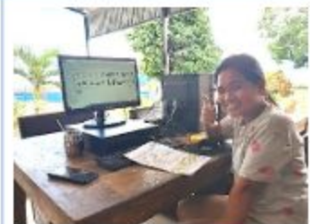
Astin bezig met de kassa applicatie